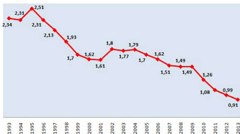
Graf 1: Vývoj výšky rozpočtových prostriedkov skutočne vyčlenených v rokoch 1993 – 2011 a plánovaných vyčleniť v rokoch 2012 – 2013 v prospech MO SR zo štátneho rozpočtu (v % k HDP SR)

jednotlivých členov Aliancie. Jeho vyjadrenia: „Zaostávate. Potrebujete viac peňazí!“, alebo „Škrty vo Vašom rozpočte na obranu sú pre Alianciu sklamaním,“ ako aj ďalšie kritické slová týkajúce sa neplnenia, príp. oddávovania plnenia Cieľov síl, ku ktorým sa SR zaviazala sú potvrdením skutočného stavu v oblasti financovania obrany. Zároveň sú reálnym odrazom výšky prostriedkov, ktoré vláda a parlament vyčlenili alebo plánujú vyčleniť v prospech ministerstva obrany (ozbrojených síl).